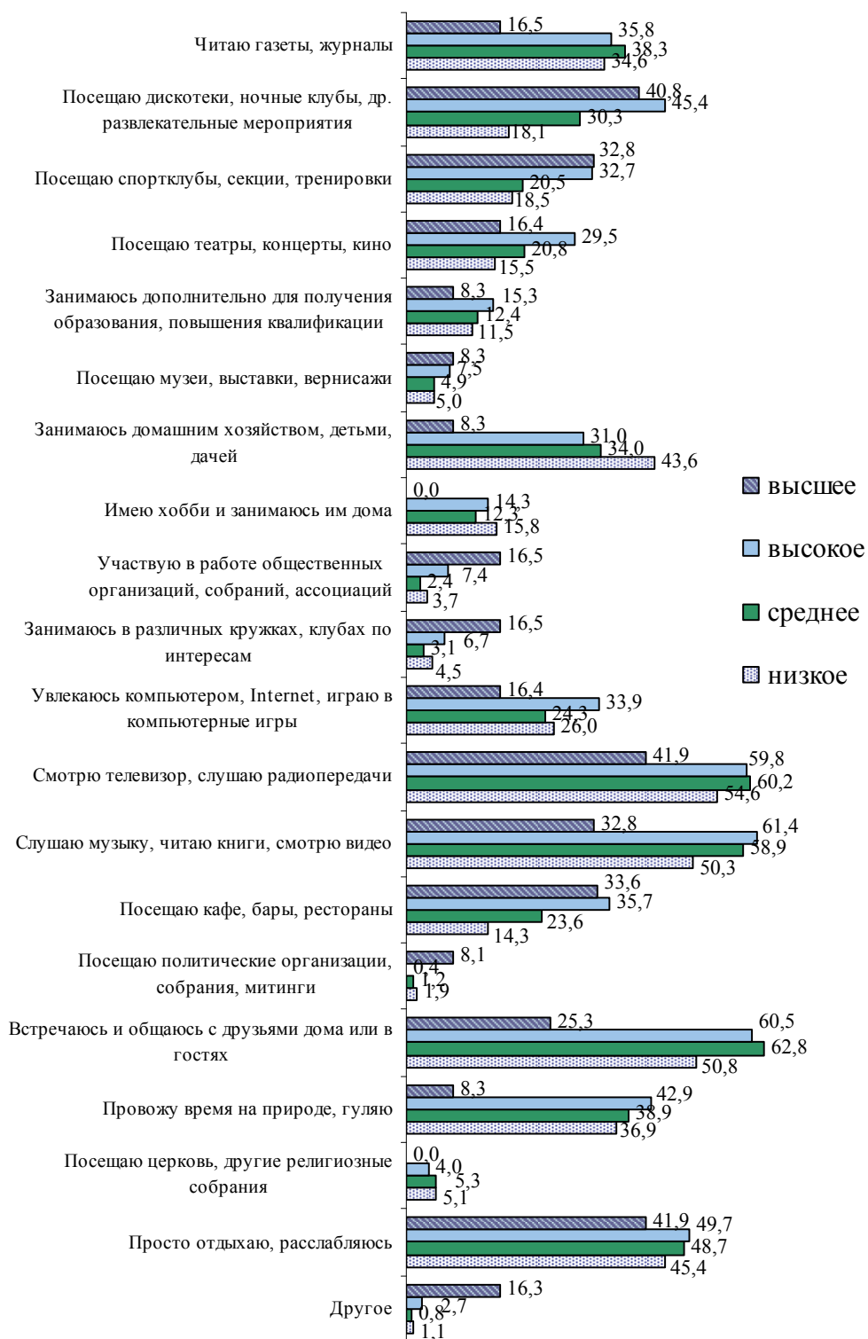
Рис. 3. Способы проведения свободного времени респондентами в зависимости от их социального положения, %